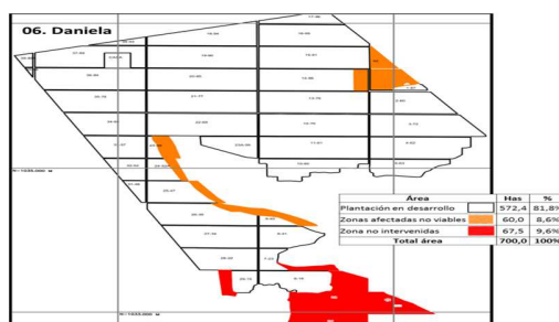
Mapa 1. Resultado de Censo realizado sobre Compartimento 06.

El valor total del deterioro $283.301.091 en los activos biológicos, las hectáreas viables del compartimento son de 82% de las hectáreas reportadas anteriormente, equivalente a 572,4 hectáreas. Por último, adjuntamos el plano correspondiente a las siguientes hectáreas.