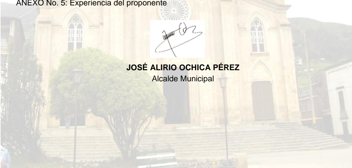
JOSÉ ALIRIO OCHICA PÉREZ Alcalde Municipal