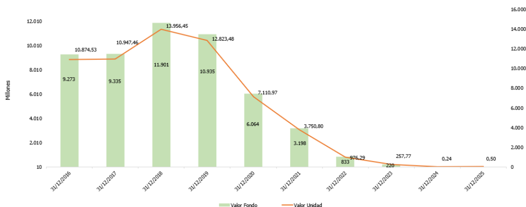
Valor del Fondo VS Valor de la Unidad - Valor Forestal 10

Cifras expresadas en millones de pesos