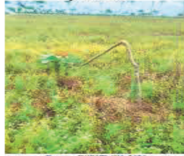
Fotografía 2. Árbol de caucho partido por Danta ( Tapirus terrestris )