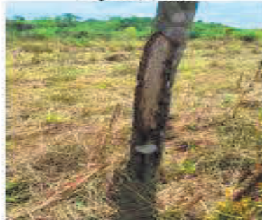
Fotografía 1. Daño al panel de sangría por danta ( Tapirus terrestris )

Adicionalmente es importante mencionar de acuerdo con un censo realizado en el año 2020, entre las plantaciones de los Fondos de Capital Privado Valor Forestal Caucho Natural 02, 04, 05, 06, 07, 08, y 10, 838,6 Ha han sido afectadas por la excesos de humedad, y daños causados por la danta ( Tapirus terrestris ) y el venado cola blanca ( Odocoileus virginianus ); esta afectación genera un deterioro de la inversión, ya que está no puede ser recuperada.