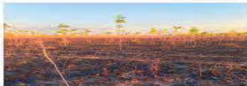
Fotografía 4. Incendio presentado en el mes de marzo de 2021