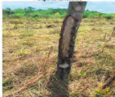
Fotografía 1. Daño al panel de sangría por danta ( Tapirus terrestris )

Adicionalmente es importante mencionar de acuerdo con un censo realizado en el año 2020, entre las plantaciones de los Fondos de Capital Privado Valor Forestal Caucho Natural 02, 04, 05, 06, 07, 08, y 10, 838,6 Ha han sido afectadas por la excesos de humedad, y daños causados por la danta ( Tapirus terrestris ) y el venado cola blanca ( Odocoileus virginianus ); esta afectación genera un deterioro de la inversión, ya que está no puede ser recuperada.