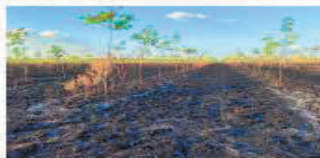
Fotografía 3. Incendio presentado en el mes de marzo de 2021

Lastimosamente en el mes de marzo de 2020 en la plantación del Fondo de Capital Privado Valor Forestal Caucho Natural 07, se presentó un incendio que afectó un total de 202,6 Ha, y el pasado mes de marzo del año en curso, se presentó otro incendio que afectó un total de 8 Ha en la plantación del Fondo de Capital Privado Valor Forestal Caucho Natural 10; al igual que los daños causados por la fauna silvestre, estos eventos generan un deterioro al 100% de la inversión.