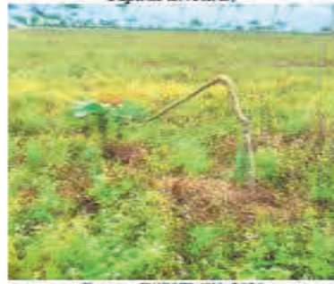
Fotografía 2. Árbol de caucho partido por Danta ( Tapirus terrestris )