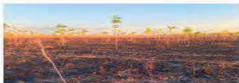
Fotografía 4. Incendio presentado en el mes de marzo de 2021