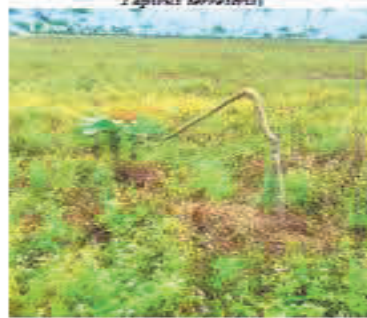
Fotografía 2. Árbol de caucho partido por Danta ( Tapirus terrestris )