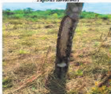
Fotografía 1. Daño al panel de sangría por danta ( Tapirus terrestris )

Adicionalmente es importante mencionar de acuerdo con un censo realizado en el año 2020, entre las plantaciones de los Fondos de Capital Privado Valor Forestal Caucho Natural 02, 04, 05, 06, 07, 08, y 10, 838,6 Ha han sido afectadas por la excesos de humedad, y daños causados por la danta ( Tapirus terrestris ) y el venado cola blanca ( Odocoileus virginianus ); esta afectación genera un deterioro de la inversión, ya que está no puede ser recuperada.