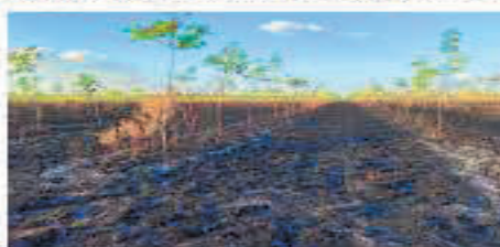
Fotografía 3. Incendio presentado en el mes de marzo de 2021

Lastimosamente en el mes de marzo de 2020 en la plantación del Fondo de Capital Privado Valor Forestal Caucho Natural 07, se presentó un incendio que afectó un total de 202,6 Ha, y el pasado mes de marzo del año en curso, se presentó otro incendio que afectó un total de 8 Ha en la plantación del Fondo de Capital Privado Valor Forestal Caucho Natural 10; al igual que los daños causados por la fauna silvestre, estos eventos generan un deterioro al 100% de la inversión.